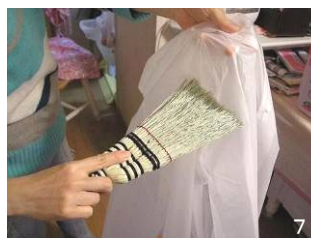
7 コートやシートにハケをかける。クシやブラシなどは水洗いをする。