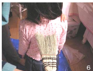
6 コートやシートにハケをかける。