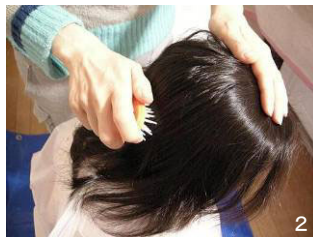
2 クシどおりをよくするために、ブラシで全体をとかし髪のもつれをとる。