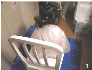
1 ビニールシートを敷いたイスにレインコートを着せて座らせる。

スキグシが入手できない場合には、卵や幼虫を完全に除くことはできませんが、できるだけ目の細かいクシで代用し、成虫を取ってあげましょう。