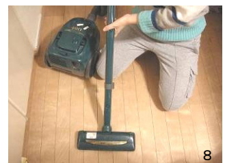
8 床に掃除機をかける。取れたアタマジラミや髪はゴミ箱に捨てる。