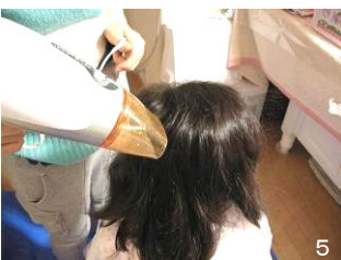
5 髪をすべてとかし終えたら、ドライヤーで乾かす。