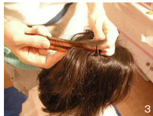
3 髪を小分けにし、水で濡らしたクシで根元から先端までとかす。とかすごとにクシを明らかに照らし、シラミが付着していないことを確認する。付いている場合は水洗いをする。同じ箇所を2~3回くらいとかす。