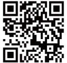
災害トピックス(総合)