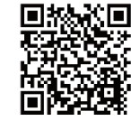
杉並区震災救援所