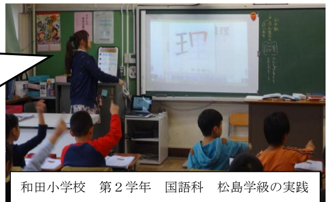
和田小学校 第2学年 国語科 松島学級の実践