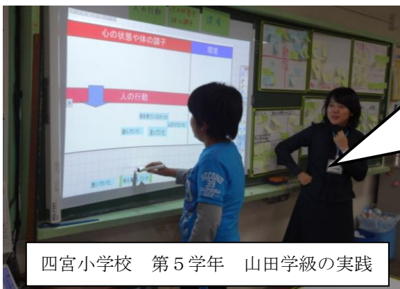
四宮小学校 第5学年 山田学級の実践

一步、横にずれて資料提示や説明をするだけで、サイドに座っている子どもの死角をなくすことができます。子どもたちに発表させる時も同様です。