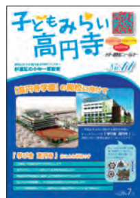
小中一貫教育 ニュースレター 「子どもみらい高円寺」

平成19年以降、高円寺学園の開校（3校統合）に向けて、小学生が中学校に行って授業や部活動体験をしたり、小学校2校による交流活動等を行ったりして連携を深め、学び合ってきました。