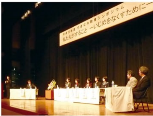
来場者も交えて、いじめについて議論しました

児童・生徒をはじめ保護者・教職員そして地域の大人が500名近く集まり、活発な意見交換を行うことができました。最後には、「大人が率先して、違いを認めていこう。そして、地域の中に子どもの居場所として多様な場をつくっていこう」ということが共有されました。