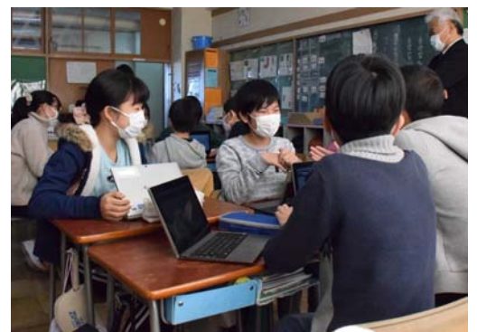
どうしたら自分も周りの人も一緒にしあわせになれるのか。白熱した議論が展開しました。

『みんなのしあわせ』ではないか」など、グループごとにさまざまな意見が出ました。「みんなが自分の好きなことをできることが『みんなのしあわせ』」と考え始めたグループでは、「自由と自分勝手の違いは何か」という議論に発展させ、「みんながルールを守りながらある程度自由でいられることが『みんなのしあわせ』である」という考えに辿り着きました。