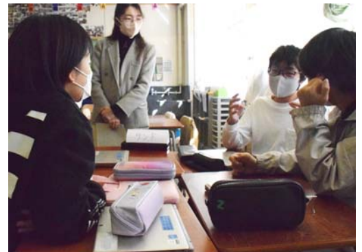
グループ活動の様子。自分の好きなことや、大切にしていることについて自由に話しました。

「家でごろごろしている時がしあわせ」「友達と遊んでいる時がしあわせ」「勉強は好きじゃないけど、気が付いたらすごく集中して勉強している時があって、そんな時にしあわせを感じる」など、思い思いに自分のしあわせを話しました。「私は、落語や大道芸を観るのが好き」という発言から今まで知らなかった児童の一面を知って盛り上がるグループや、「やりたいことや楽しいことは日によって違う。日によってしあわせは変わるのかも」という気づきを共有するグループなど、自分のしあわせを発表し合うことをきっかけに、各グループにさまざまな話し合いが展開されていきました。