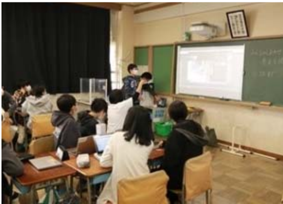
タブレットに入力した話し合いの内容を電子黒板に映し、さらにオンライン会議のソフトを使用して、別のクラスにも自分たちの意見を伝えました。