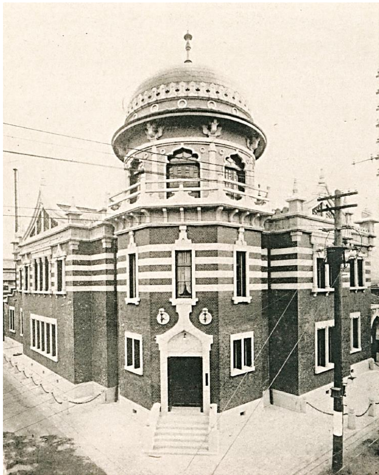
西本願寺伝道院/旧真宗信徒生命株式会社社屋