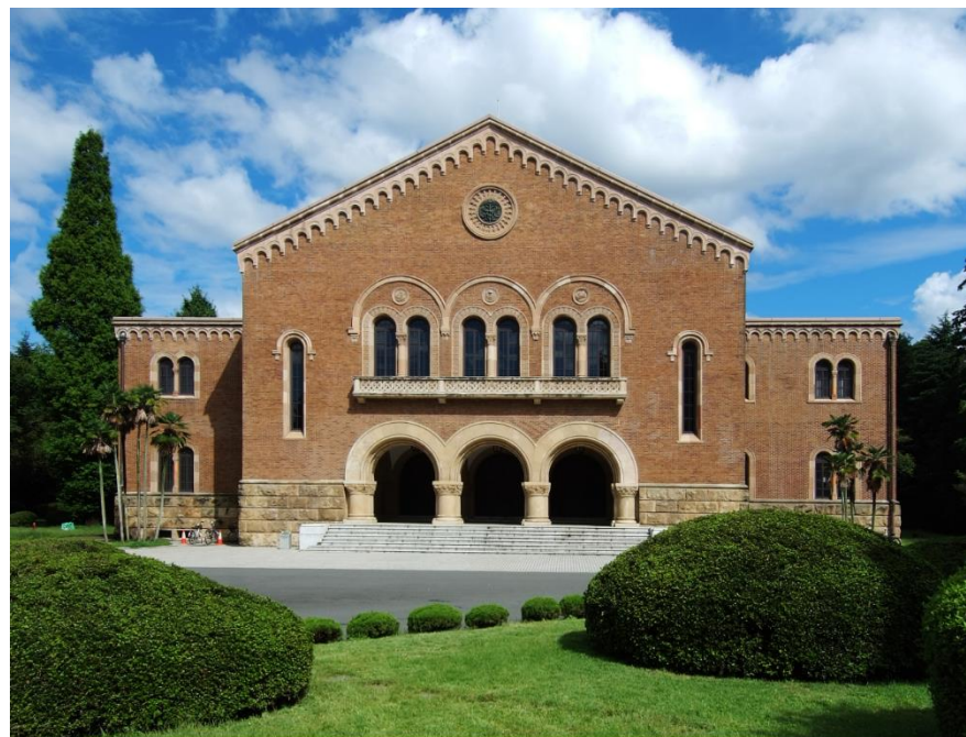
一橋大学兼松講堂