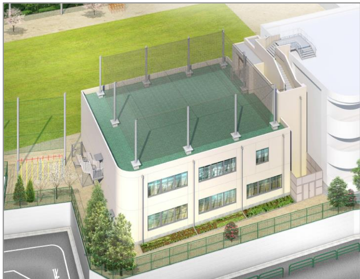
（増築棟完成イメージ図 敷地南側より）