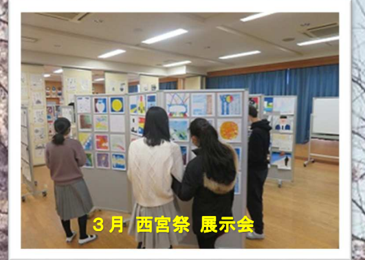
3月 西宮祭 展示会