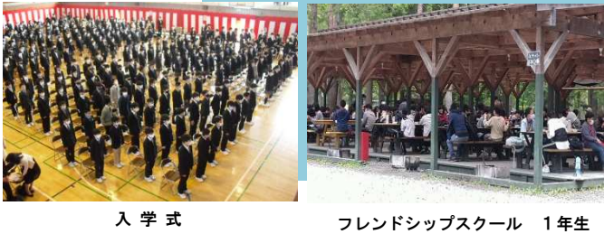
入学式 フレンドシップスクール 1年生