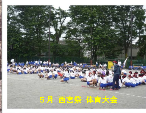
5月 西宮祭 体育大会