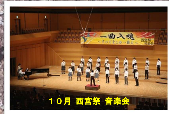
10月 西宮祭 音楽会