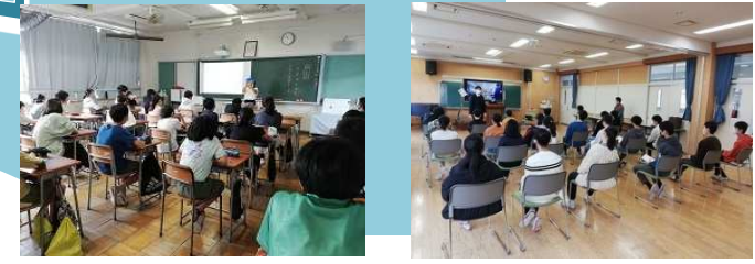
9月 土曜授業「誕生学」 インターネット回線を用いたオーストラリアの高校との交流