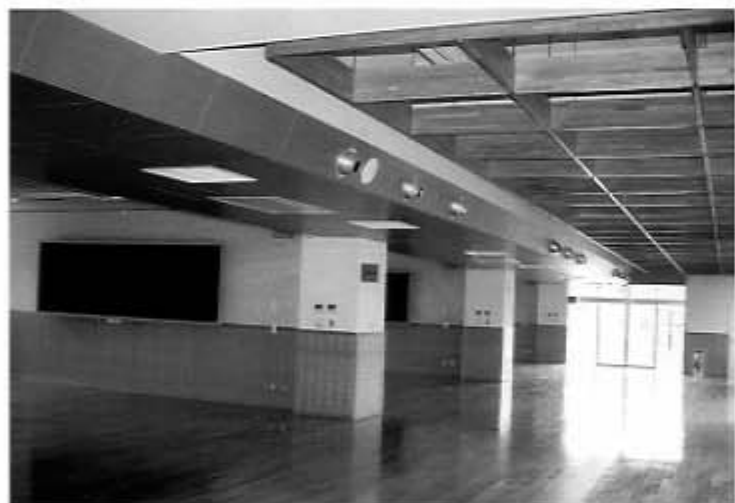
オープンスペースと一体となった教室