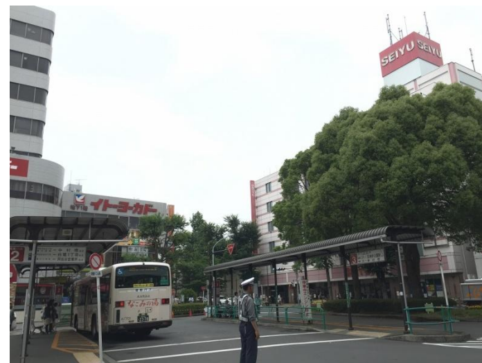
①駅前から敷地方向