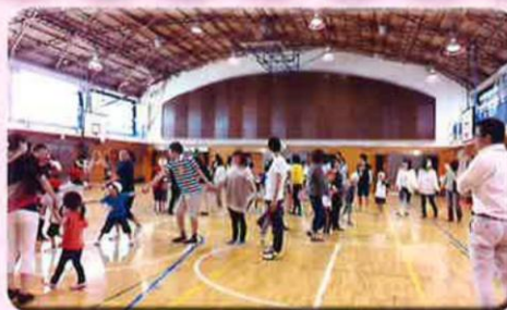
親子での土曜授業