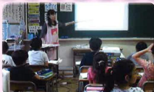
少人数指導による学習(2年生から)