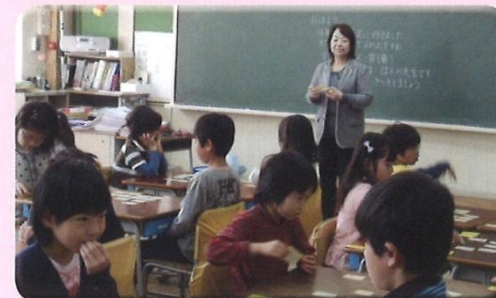
朝の「杉一学習」(朝先生)