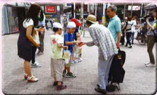
阿佐ヶ谷駅でのアサガオ配り