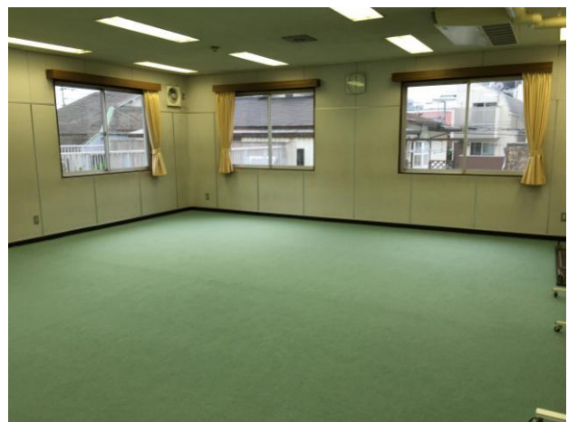
レクリエーション室