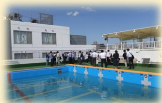
プールの棟視察の様子（方南小）