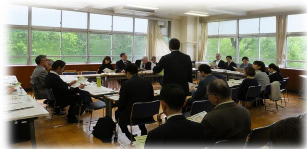
第1回校舎改築検討懇談会の様子