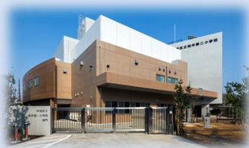
杉並区立桃井第二小学校