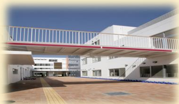
杉並区立方南小学校