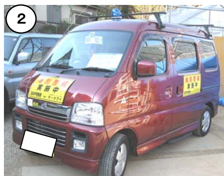
杉並自主パトロール隊「ホークアイ」パトロール車