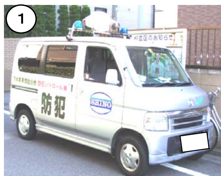
「下井草東部自治会」パトロール車