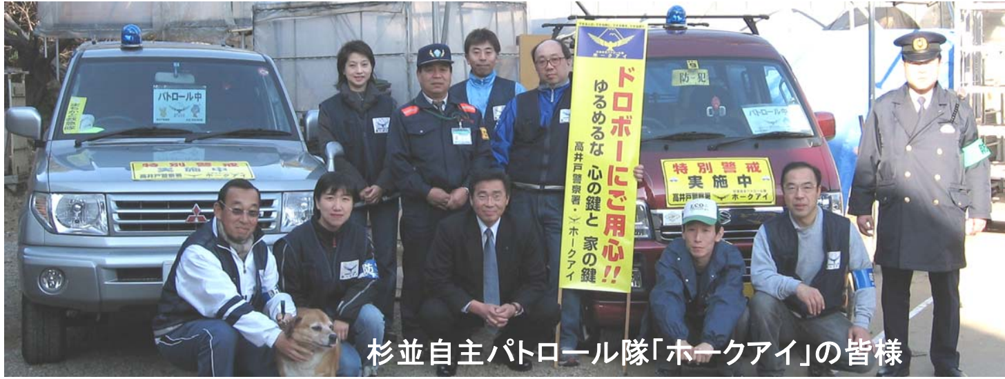
杉並自主パトロール隊「ホークアイ」の皆様

青色回転灯を装備した防犯自主団体のパトロール車が今回新たに2台増え3台になりました。