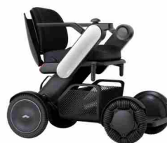
次世代電動車いす