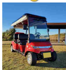
グリーンスローモビリティ

広報すぎなみ3月15日号にて試乗申込方法やイベントの詳細についてご案内いたします。