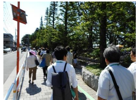
「まち歩き」のイメージ