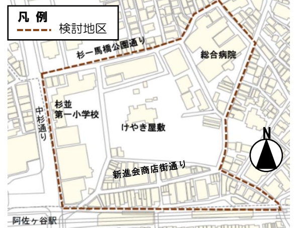
まちづくり検討地区(まちづくり計画対象地区)

※「(仮称)阿佐ヶ谷駅北東地区まちづくり計画」とは、「阿佐ヶ谷駅等周辺まちづくり方針」など関連する上位計画、地域からの意見、地域の現状や課題等を背景として、まちづくりの目標や方針、それらを実現する手法(地区計画等の都市計画の決定、関連する制度や事業の活用など)を位置づけるものです。