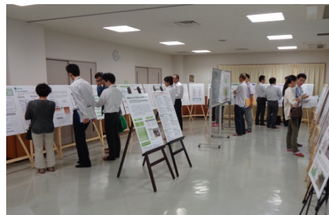
■ オープンハウスの様子