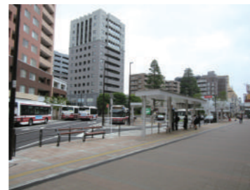
(事例写真) 駅前広場のイメージ