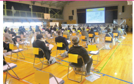
説明会の様子(10月9日四宮小学校)