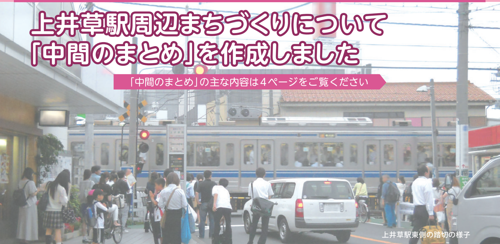
上井草駅東側の踏切の様子