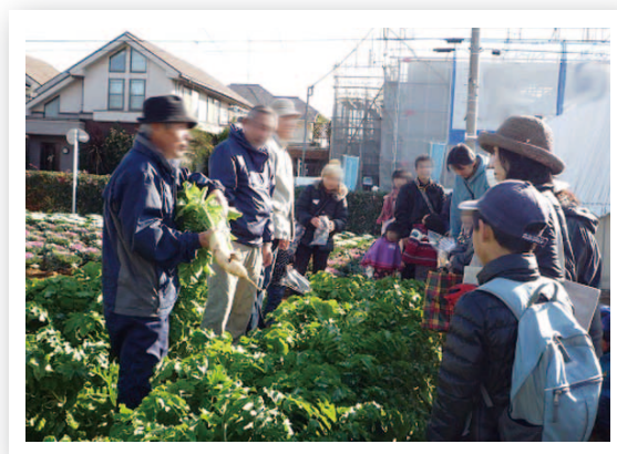
ふれあい農業体験

※ 農業体験農園…園主(農家)が開設し、利用者は園主が定めた年間計画に沿って、苗の植え付けから栽培管理・収穫までの農作業を、園主の指導のもと体験できる農園