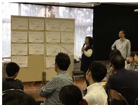
各グループの発表