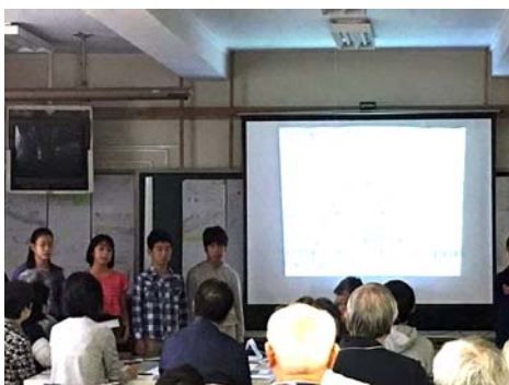
井荻小学校児童の発表