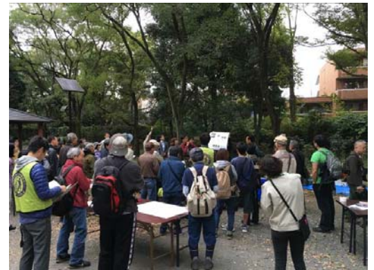
専門家による調査概要の説明