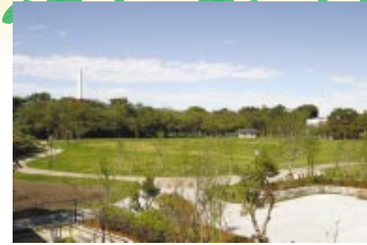
管理事務所から見た草地広場

現在の日本庭園は、安全のため、池の周辺にチョットと無粋なフェンスがありますが、池中央の石橋は実用と景観の両面で水と立体的に関係して、庭の水景に貢献しています。また、立派な灯籠・蹲・石橋・飛石・組石や、ツツジなどの低木などが配置され、心休まる憩いの空間が構成されています。近くに水生生物の池、溜池、水田など、多目的に利用される公園ならではの施設もあり、自然と親しめる総合施設として、区民の皆さんに大いに利用してほしいものです。