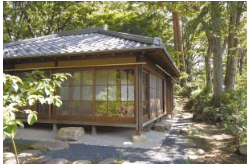
茶室(林丘亭)の落ちついたたたずまい