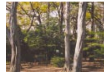
武蔵野の面影を残す疎林広場