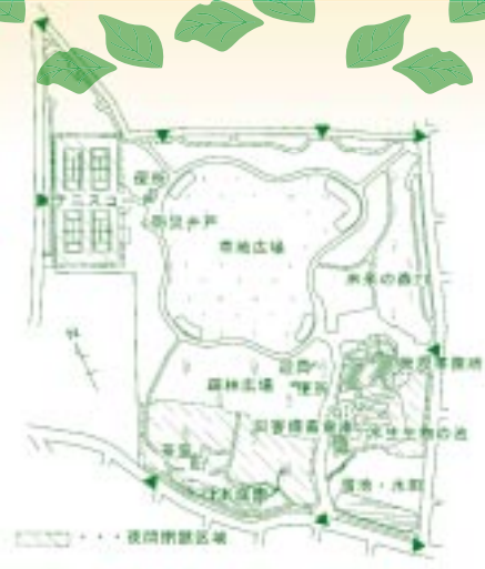
柏の宮公園 平面図