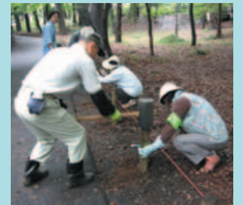
ロープ柵の設置なども