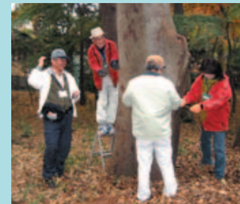
樹名板の製作・取り付け