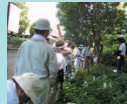
ボランティアの先輩に教えてもらいながらの植物管理

作業は力仕事に不得意ですが、それでも参加してみるとなんだか楽しい、のびのびした気分になります。木や草が相手だからでしょうか。「みどりとひと」の編集は、会議や取材の時にいろいろ教えていただくことも多く、また新聞という形で残るのはうれしいものです。