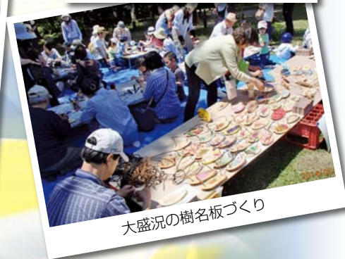
大盛況の樹名板づくり