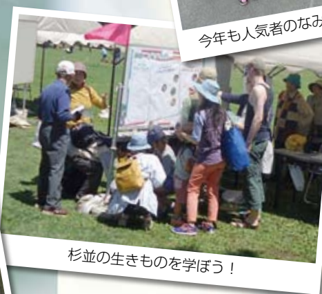
杉並の生きものを学ぼう！