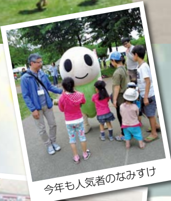
今年も人気者のなみすけ