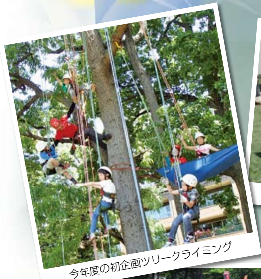
今年度の初企画ツリークライミング