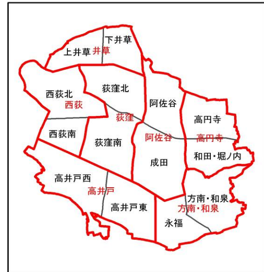
地域・ゾーン区分図