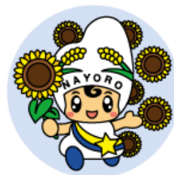
名寄市観光キャラクター なよろ