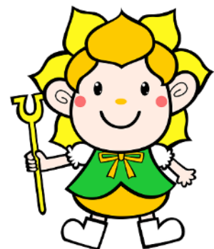
東吾妻町マスコットキャラクター 水仙ちゃん

現在、杉並区とは本事業やバレーボール交流会等を実施するほか、毎月杉並区役所で特産品の販売を行っています。