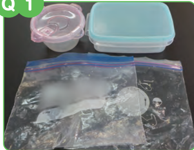
プラスチック製の保存容器やジッパー付き保存袋