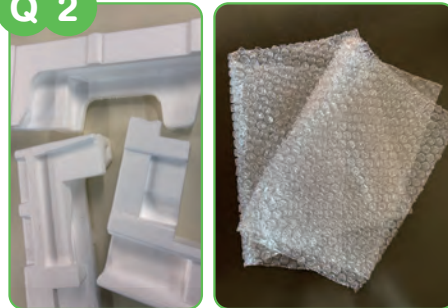
汚れていない発砲スチロールや気泡緩衝材(プチプチ)