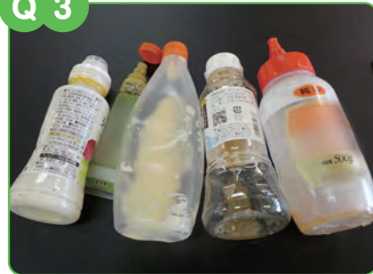
汚れの取れないプラスチック製容器包装