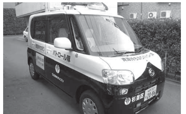
▲資源持ち去り監視パトロール車