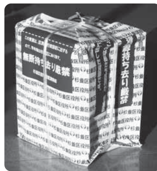
▲区専用新聞回収袋

5月1日(金)から新たに罰則規定を設けた「杉並区廃棄物の処理及び再利用に関する条例」を適用し、資源の持ち去りを繰り返す違反行為者に対しては、20万円以下の罰金を科すなど厳しく対処するようになりました。