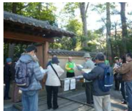
まち歩きイベント(太田黒公園前)