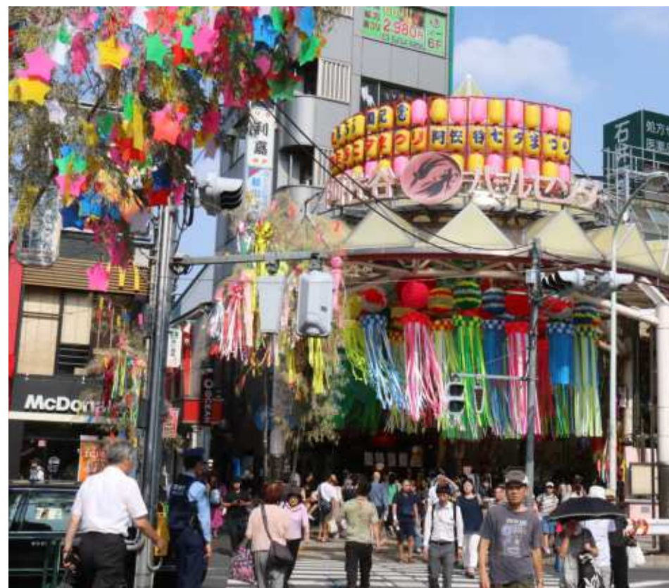
阿佐谷七夕まつり