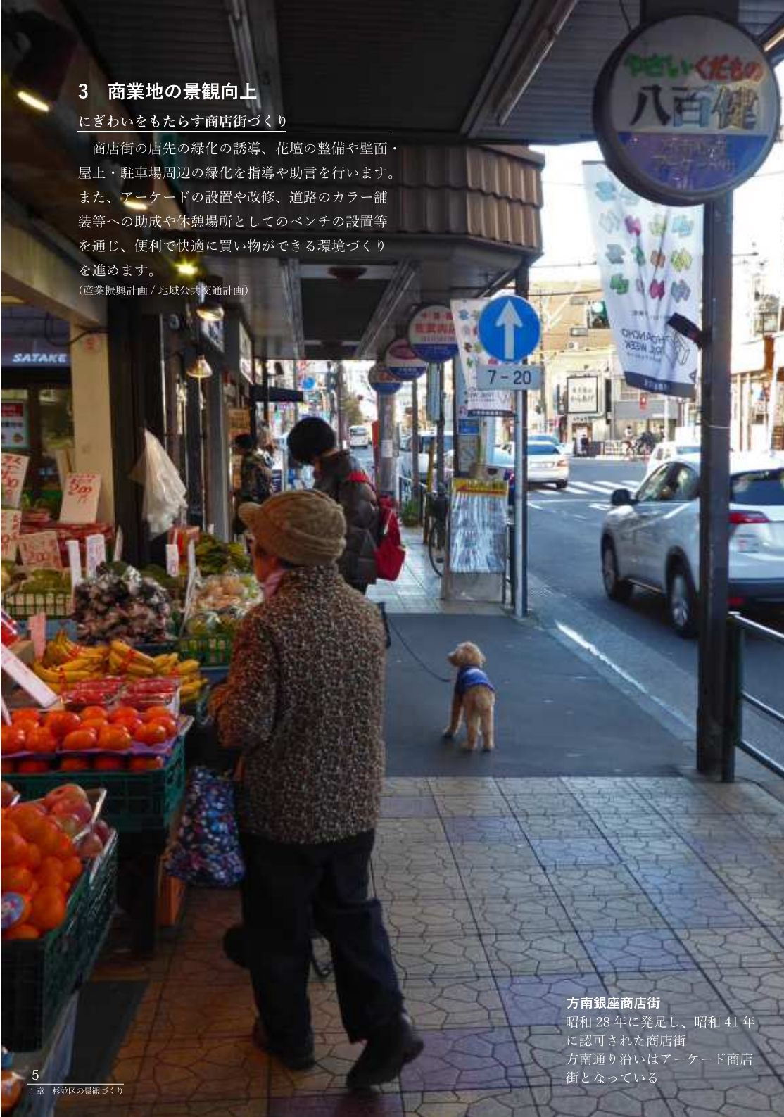
方南銀座商店街 昭和28年に発足し、昭和41年に認可された商店街 方南通り沿いはアーケード商店街となっている