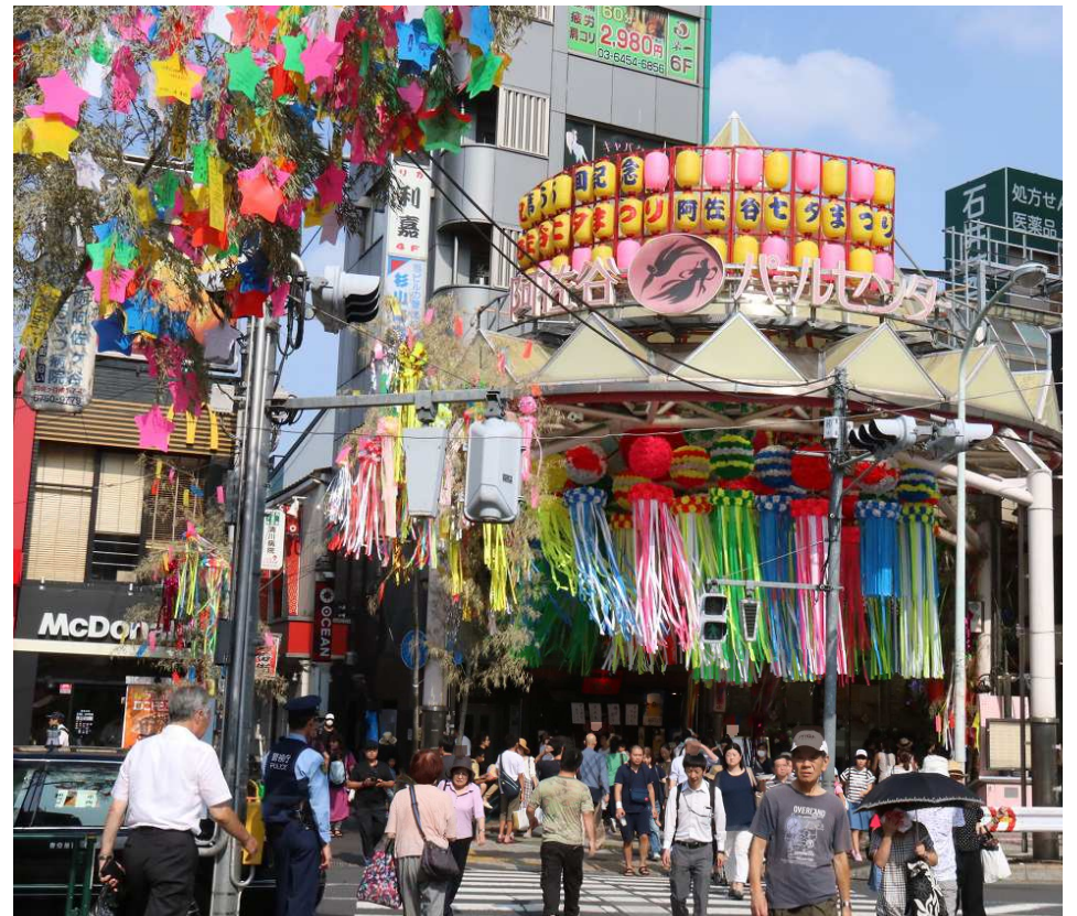
阿佐谷七夕まつり