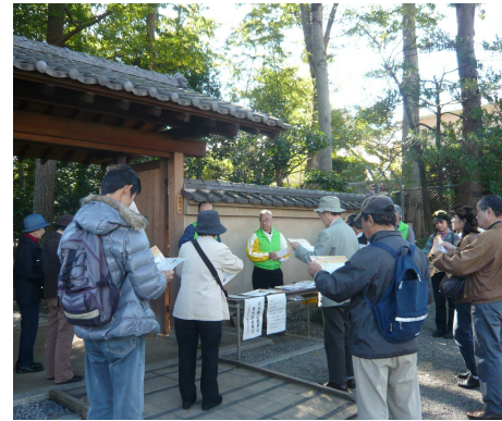
まち歩きイベント(太田黒公園前)