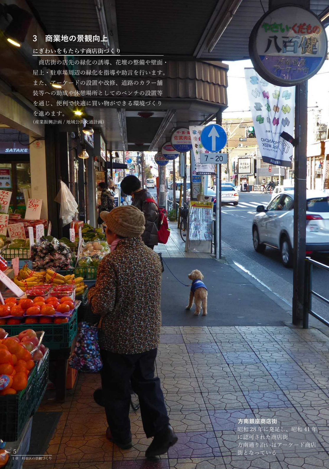
方南銀座商店街 昭和28年に発足し、昭和41年に認可された商店街 方南通り沿いはアーケード商店街となっている