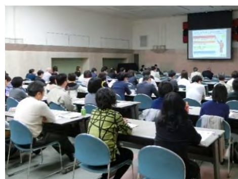
LGBT等に関する職員研修の様子