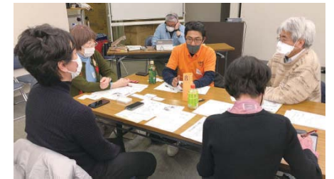
荻窪圏域は対面とオンラインのハイブリッド開催

など利用者について気付くことがあったら薬局からかかりつけ医へ連絡してほしい」、「ケアマネジャーは月に1回しか本人に会わないので、本人の日常を知る人たちから日頃の様子を聞ける仕組みがあるとよい」などの意見がありました。「早期発見」については、「見守りが必要な独居高齢者の近隣住民、スーパーのレジ係、美容院、民生委員などに、異変に気付いたら知らせるべき窓口を周知しておく」と、「若い世代にも地域包括支援センターをもっと広報した方がよい」といった声がありました。また、歯科医師からは、「外来で高齢者を治療しているが、これからは患者のより多くの背景情報を仕入れて、見守る意識を持って診ていきたい」とのコメントがありました。