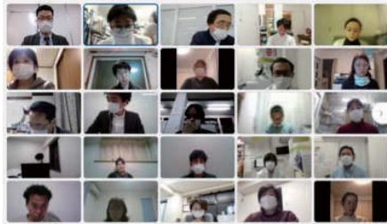
グループワークの発表の様子

一方で、入院・在宅に関わらず、息子の依存症治療が重要という意見が多くありましたが、問題はそこに至る過程です。入れ代わり立ち代わり訪問すると、息子がパニックを起こす恐れがあるため、多職種で連携しながら一つずつ慎重にサービスを入れていった方がいいとの指摘がありました。また、訪問は二人以上で行わないと危ないと懸念する声も出ました。息子とどうやって信頼関係を築くかが最初の関門になりそうです。そのほか、後見人制度、金銭管理代行サービスなどの利用を勧めるアドバイスも出ていました。