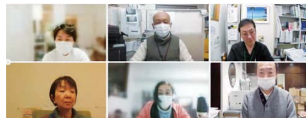
オンラインでのグループワークの様子

阿佐谷圏域の地域ケア会議は3月2日、「薬剤師との連携を深めよう」をテーマに、オンラインで開催しました。約50人の参加者のうち、約20人が薬剤師であり、阿佐谷圏域の薬剤師が多職種連携に大きな関心を寄せていることが伺えました。グループワークでは各グループに3人の薬剤師が入り、在宅医療における患者の服薬で困っていること、分からないことなどについて意見を出し合いました。