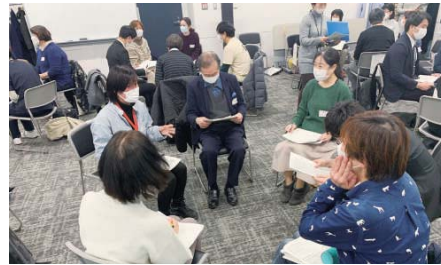
車座で話し合う西荻圏域のグループワーク

ない退院時カンファレンスがコロナ禍で開催されなかったことや、必要な職種が参加できず、十分な情報共有が行われていないことでした。例えば、「救急搬送された患者が退院したら、主治医ではない医師が担当になっていた、ケアマネジャーに連絡が行ってなかったりするケースがある。患者と信頼関係があるところへ帰してほしい」という声が聞かれました。また、「退院が決まってから在宅療養の対応を考えるのではなく、入院中に準備しておく必要がある」という意見も出ていました。こうした課題を解決するためにも、適宜バイタルリンク(杉弁ネット)などのICTを活用して、情報共有することが必要だとする指摘がありました。