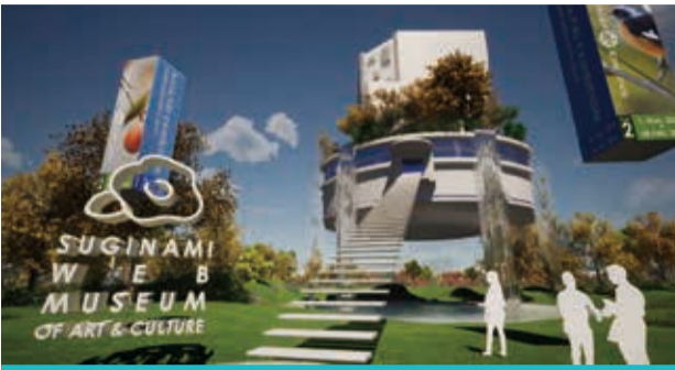
↑四季折々で、風景の変化も楽しめます

杉並区とNPO法人チューニング・フォー・ザ・フューチャー(TFF)が協働して運営する「スギナミ・ウェブ・ミュージアム」はパソコンやスマートフォン等で楽しむ仮想美術館です。荻窪ゆかりの巨匠・棟方志功の作品展示をはじめ、コンテンツも充実してきました。リアルな美術館とはひと味違う展示や、四季折々に移り変わる周囲の風景など楽しいしかけもいっぱいです。おかけがままならない時も美術館さんぽを楽しんでみてください。