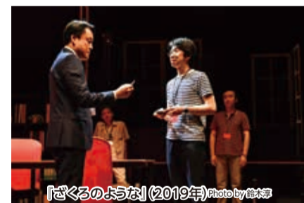
『さぐるような』(2019年)