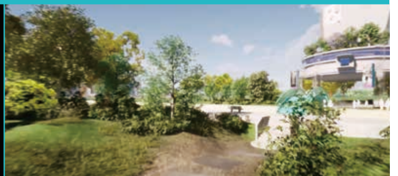
↑ここは善福寺川？ 区内の風景も楽しめる