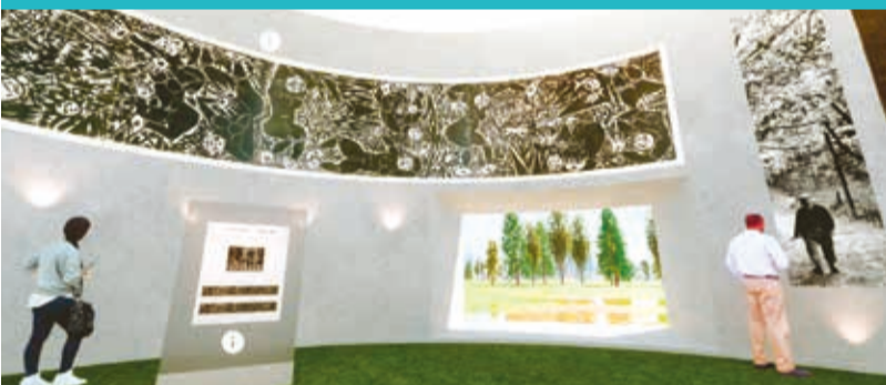
↑長さ10mを越す棟方志功の大作もぐるりパノラマで