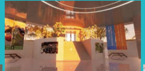
↑昼夜で明るさが変わる演出も