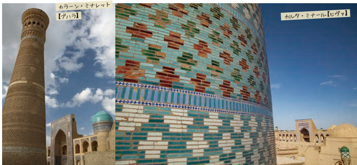
カラーン・ミナレット 【ブハラ】