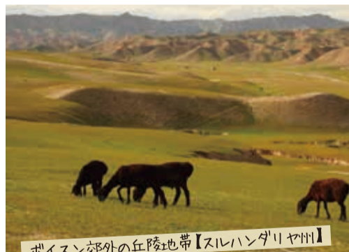
ポイスン郊外の丘陵地帯【スルハングリヤ州】

▲▼壮大な自然もウズベキスタンの魅力。首都から車を2時間も走らせると大自然が四季折々の表情を見せ、ハイキングやスキーも楽しめる。