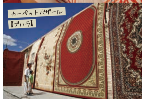
カーペットバザール 【ブハラ】

▲屋外のバザールは雨が少ない土地ならではの。スザニ(刺しゅう)やカーペットは壁掛けにして部屋の装飾としても使われる。