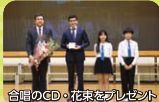
合唱のCD・花束をプレゼント