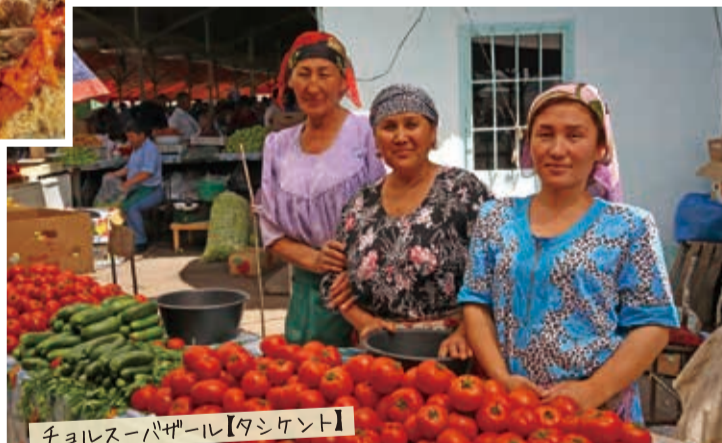
チョルスーバザール【タシケント】

◀羊肉、ニンジン、玉ねぎを使った炊き込みご飯。結婚式など大勢の人が集まる時に必ずと言ってよいほど振る舞われる。 ▼人々の熱気であふれる首都のバザール。