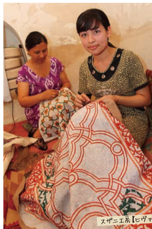
スザニ工房【ヒザヤ】