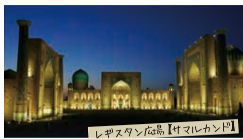
レギスタン広場【サマルカンド】

▲巨大な神学校、博物館都市とも呼ばれる世界遺産ヒヴァ、様々な戦禍をくぐりぬけた日干しレンガで作られた塔、青の都を象徴する青タイルの建築群など歴史的な建造物に見応えがある。