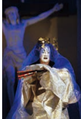
「長崎の聖母」(2005年)

250年もの歴史をもつ演能団体、鏡仙会が座・高円寺で初上演。2019年にヨーロッパ3都市で上演した、核兵器や差別を扱った新作能を2本お