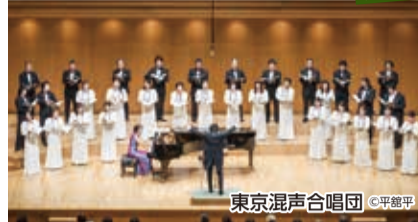
東京混声合唱団

場 杉並公会堂 大ホール 全席指定(各回)/一般3,000円、学生1,500円(学生：25歳以下/席数限定/東京混声合唱団のみ取扱い)