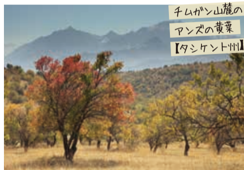
千山麓の アムズの黄葉 【タシケント州】

▲巨大な神学校、博物館都市とも呼ばれる世界遺産ヒヴァ、様々な戦禍をくぐりぬけた日干しレンガで作られた塔、青の都を象徴する青タイルの建築群など歴史的な建造物に見応えがある。