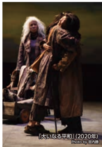
「大いなる平和」(2020年)