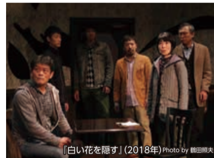
「白い花を隠す」(2018年)