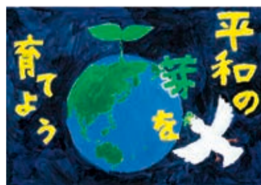
令和2年度金賞受賞作品の一部