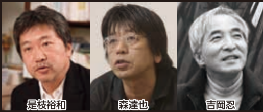
是枝裕和