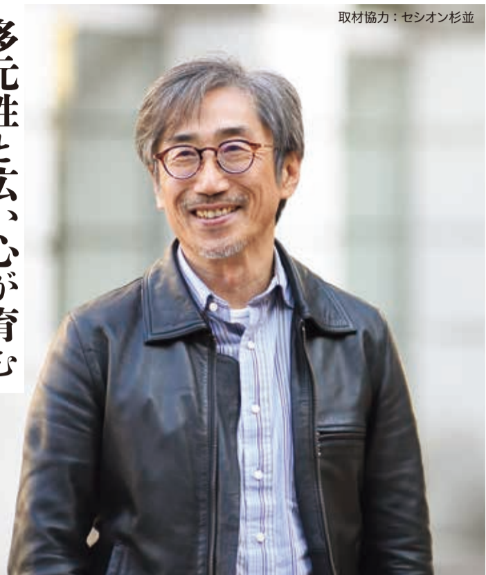
取材協力：セシオン杉並