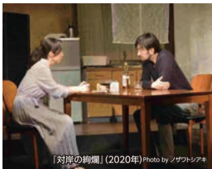
「対岸の絢爛」(2020年)

建築業を営む一族とそれを取り巻く地域社会を舞台に、昭和の選挙や資本主義の間、女性たちの生き方を描く物語。