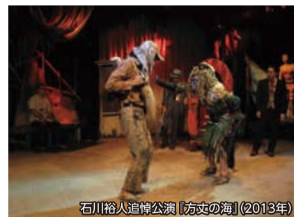
石川裕人追悼公演「方丈の海」(2013年)

2012年に描かれた東日本大震災の10年後の物語を、実際の10年後に上演するプロジェクト。東北の古い映画館を舞台に繰り広げられるアングラファンタジーです。