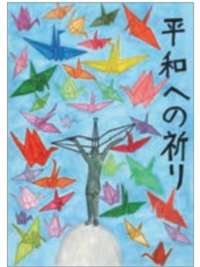
銀賞 光塩女子学院初等科 馬場 桃花