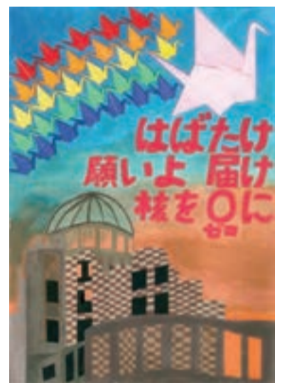
銀賞 光塩女子学院初等科 馬場 美安