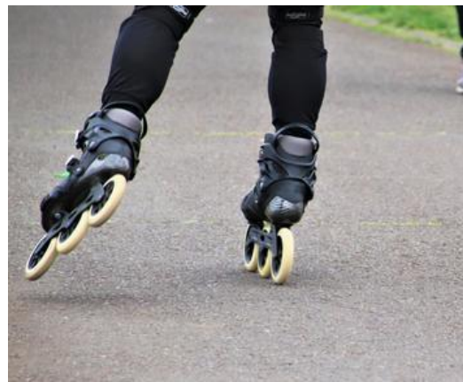
インラインスケート