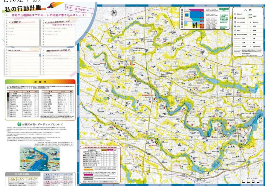
図1 わが家の水害ハザードマップ（令和2年度版）

こうした状況を踏まえ、本計画では、「わが家の水害ハザードマップ（令和2年度版）」における、想定し得る最大規模の降雨（1時間当たり153mm、総雨量690mm）が杉並区全域に降った場合を想定する。