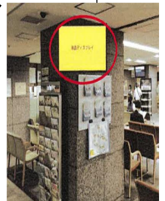
東棟 区民課 待合スペース