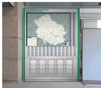
中棟 青梅街道側風除室