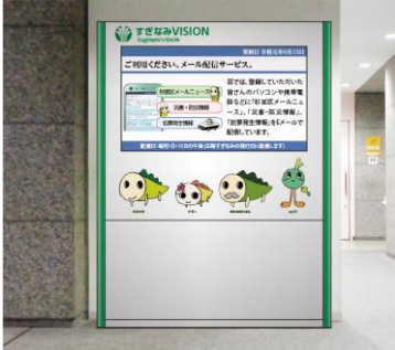
中棟 ロビー壁面 (西棟エレベーターの東側)