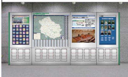
西棟 ロビー壁面 (西棟出入り口の南側)