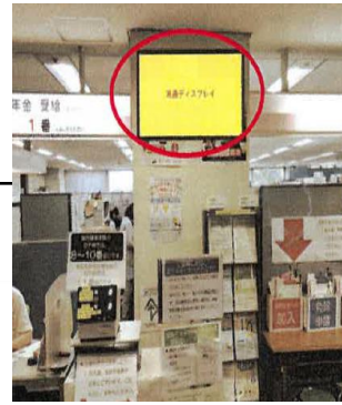
中棟 国保年金課前壁面