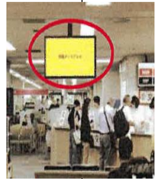
東棟 区民課区民係 カウンター前