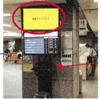
中棟 区民課戸籍係 待合スペース