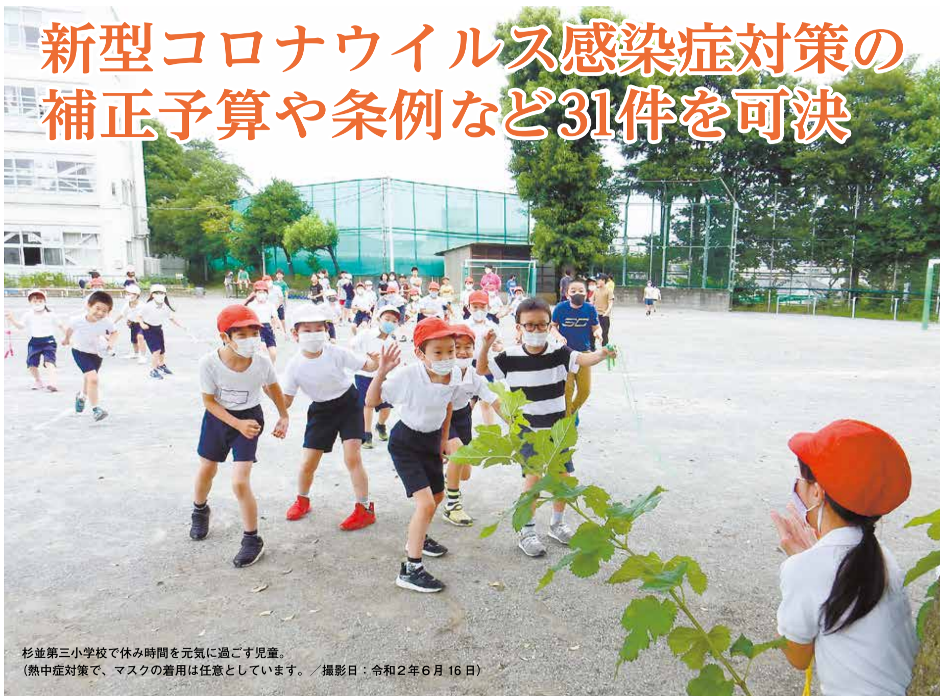
杉並第三小学校で休み時間を元気に過ごす児童。 (熱中症対策で、マスクの着用は任意としています。／撮影日：令和2年6月16日)