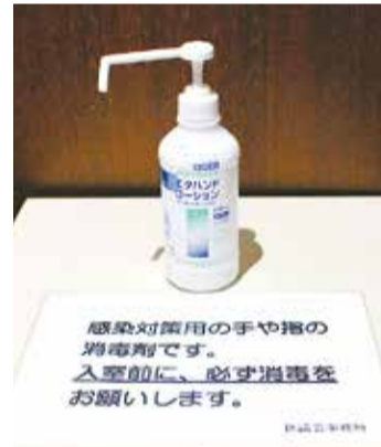
出席者及び傍聴者の議場等への入場に際し、手指消毒を徹底しています。