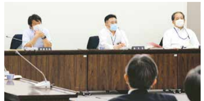
本会議と同様に出席者はマスク着用の上、委員会を実施しています。