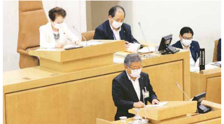
新型コロナウイルス感染症予防のため、出席者はマスク着用の上、本会議を実施しています。