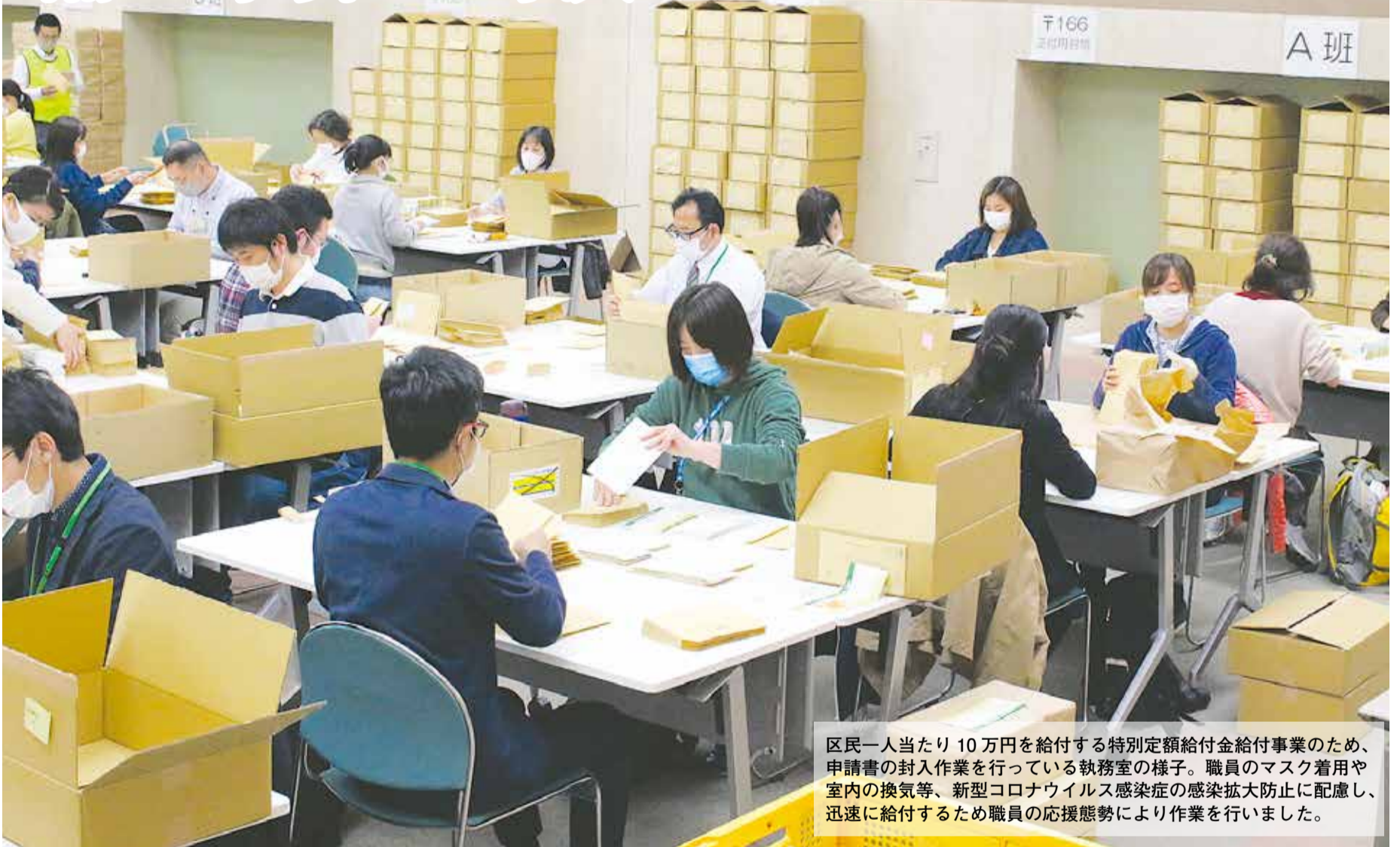
区民一人当たり10万円を給付する特別定額給付金給付事業のため、申請書の封入作業を行っている執務室の様子。職員のマスク着用や室内の換気等、新型コロナウイルス感染症の感染拡大防止に配慮し、迅速に給付するため職員の応援態勢により作業を行いました。