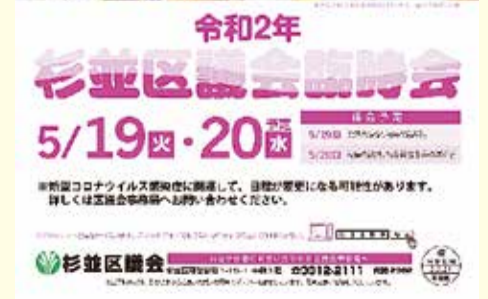
応募写真で作成した、第3回臨時会のポスター