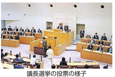
議長選挙の投票の様子