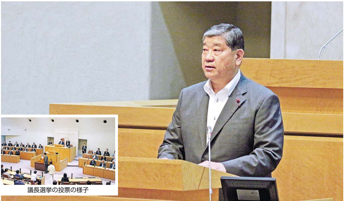
就任のあいさつをする大熊議長