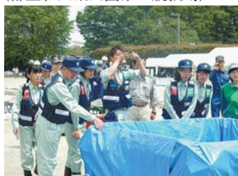
マンホール防止工法の視察