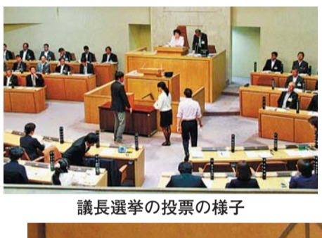
議長選挙の投票の様子