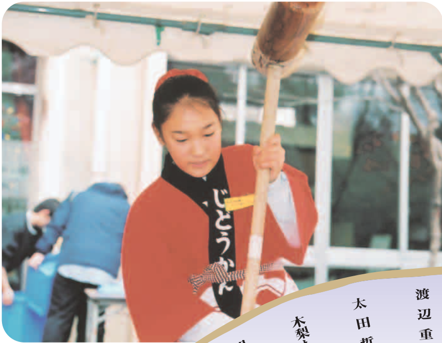
高井戸児童館のもちつき大会

http://www.gikai.city.suginami.tokyo.jp 携帯サイト http://www.gikai.city.suginami.tokyo.jp/mobile/