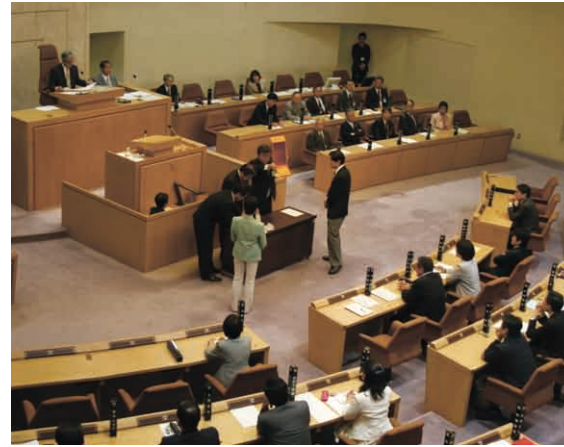
議長選挙の開票風景