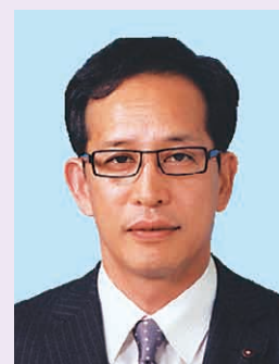
杉並区議会副議長 渡辺富士雄