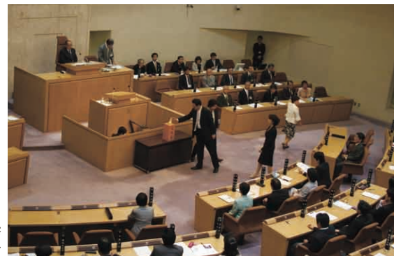
副議長選挙の投票風景