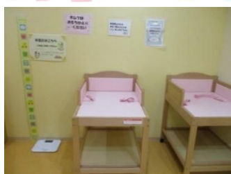
おむつ替えコーナー