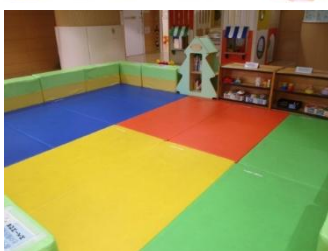
赤ちゃんコーナー